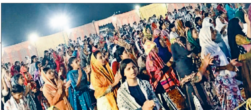
अंबाला। शांति सम्मेलन में मौजूद लोग।

कार्यक्रम में भाग लिया तथा लोगों को संबोधित भी किया। इसका एक वीडियो सामने आने के बाद संगठनों में रोष है। दरअसल मिशन अस्पताल परिसर में शुरुवार को हुए इस शांति सम्मेलन से पहले ही