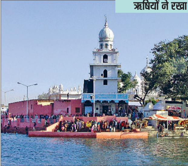
यमुनानगर। श्री कपालमोचन तीर्थ स्थल पर सोमसरोवर में भरा लबालब पवित्र जल और सरोवर तट पर जुटे श्रद्धालु।

आदिकाल में द्वैतवन में स्थित कपालमोचन तीर्थस्थल के नाम से प्रसिद्ध हो चुका तीर्थस्थल पहले औशनस के नाम से मशहूर रह चुका है। यह तीर्थस्थल असुरों के गुरु शुक्राचार्य की तपोस्थली रह चुका है। स्कंध पुराण के मुताबिक शुक्राचार्य का नाम उशनस था। इस वजह से यह तीर्थ स्थल पहले औशनस और बाद में श्रीकपाल मोचन तीर्थ स्थल के नाम प्रसिद्ध हो गया। आदिकाल में ब्रह्मा जी ने द्वैतवन स्थित औशनस तीर्थ स्थल पर पदमकाल में यज्ञ करवाने के लिए तीन हवन-कुंडों का निर्माण करवाया। जिनके नाम प्लक्ष, सोम सरोवर व ऋण मोचन रखे गए। वर्तमान में जो श्री कपालमोचन सरोवर, ऋण मोचन सरोवर सूर्य कुंड के नाम से प्रसिद्ध हो गए।