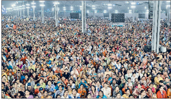
पानीपत। निरंकारी संत समागम में भाग लेते देश व विदेश से आए श्रद्धालु।