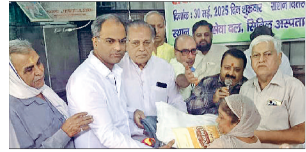
जन सेवा दल के कार्यालय में जरूरतमंदों को राशन वितरण करते अतिथिगण।