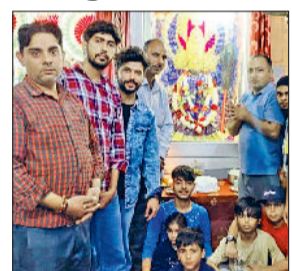
अंबाला। कार्यक्रम में उपस्थित श्रद्धालुगण।

वार्ड नंबर 15 सिंहपुरा मोहल्ला हारे के सहारे हमारे श्याम बाबा के जयकारों से गूंज उठा, अवसर था शिव सेवा मंडल सिंहपुरा की ओर से श्याम बाबा का जन्म महोत्सव का। यह कार्यक्रम बड़ी श्रद्धा और हार्मोल्स के साथ मनाया गया। इस अवसर पर भगवान खाटू श्याम प्रेमियों द्वारा क्षेत्र में जगह-जगह अटूट लंगर लगाए गए। इस दौरान शिव मंदिर महिला मोर्चा की महिलाओं ने भजन व कीर्तन के माध्यम से बाबा जी का गुणगान किया और वातावरण को भक्ति रस में सराबोर कर दिया। आरती और भजन संध्या के उपरांत शिव सेवा मंडल के सदस्यों ने बाबा के जयकारों के बीच केक काटकर जन्मदिन मनाया। महिलाओं ने नाच-गाकर अपनी श्रद्धा और उल्लास का प्रदर्शन किया।