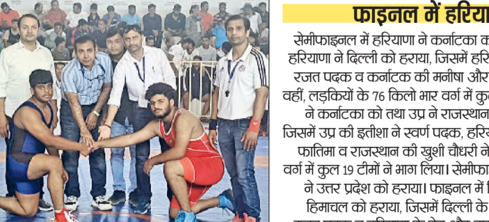
पानीपत। 69वें राष्ट्रीय कुश्ती में पहलवानों का हाथ मिलवाते अतिथिगण।