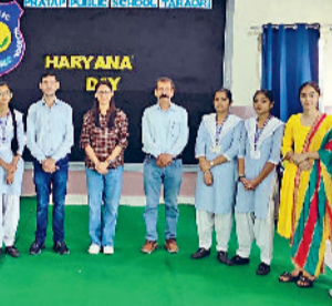
तरावड़ी। कार्यक्रम में भाग लेते स्कूल के शिक्षक।