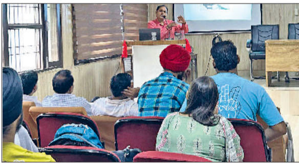
अंबाला। कार्यशाला में मौजूद छात्र।