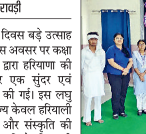
तरावड़ी। कार्यक्रम में भाग लेते प्रताप स्कूल के बच्चे।

हरियाणा की असली समृद्धि उसके मेहनतकश युवाओं में निहित है, जो अपने ज्ञान, संस्कार और प्रतिभा से उज्वल भविष्य का निर्माण करेंगे। आज हरियाणा देशभर में अपनी पहचान उज्ज्वल कृषि के साथ खेलों में भी बना रहा है, यहां अपार संभावनाएं हैं