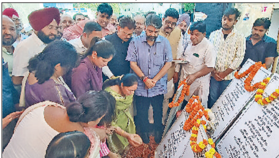
अंबाला। विकास योजनाओं का शुभारंभ करते पूर्व राज्यमंत्री असीम गोयल।

राज्यमंत्री का यहां पहुंचने पर निगम सदस्यों व अन्य गणमान्य लोगों ने पुष्पगुच्छ भेंटकर उनका भव्य अभिनंदन भी किया। गोयल ने इस मौके पर उपस्थित शहरवासियों को इन विकास कार्यों के शिलान्यास की